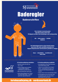
Siehe Aushang im Poolbereich