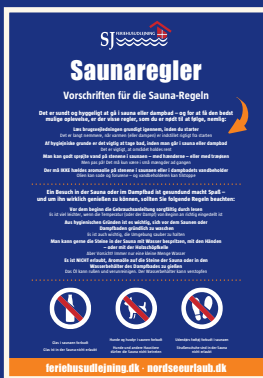
Siehe Aushang im Poolbereich

Ein Besuch in der Sauna oder im Dampfbad ist gesund und macht Spaß – und um ihn wirklich genießen zu können, sollten Sie folgende Regeln beachten: